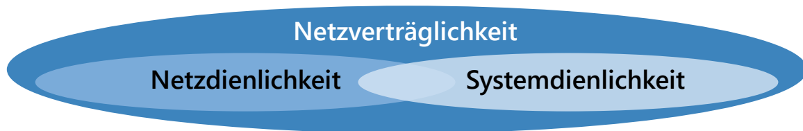
Abbildung 2: Die Grundlage für Netz- und/oder Systemdienlichkeit wird durch die Netzverträglichkeit gewährleistet